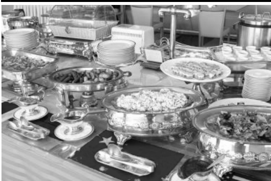
六月二十五日 マリンパレス外食